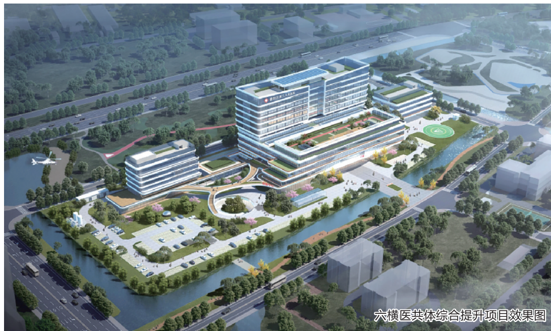
六横医共体综合提升项目效果图

据了解,该项目用地面积为3.85万平方米,总建筑面积(含地下室)为6.7万平方米。六横医疗共同体是六横整合优势医疗资源,结合普陀第二人民医院迁建,按照二级甲等医院标准,打造集门诊、急诊、住院、医技、防疫等为一体的综合性医院。项目涵盖了医疗设施的新建与升级、医疗合作平台的搭建与深化、医疗人才的汇聚与培养、医疗服务流程的重塑与再造,为社区服务中心提供支持,共同探索医共体诊疗模式,全面提升我区