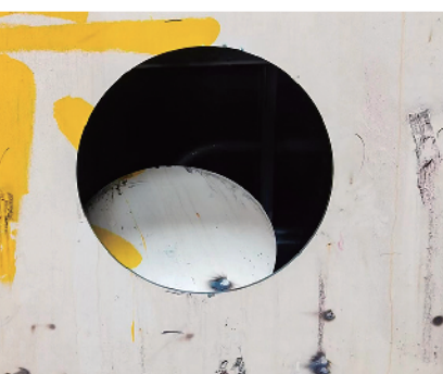
完成切割的油舱壁工艺孔