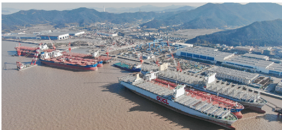
舟山中远海运重工有限公司码头泊位停满待修船舶。