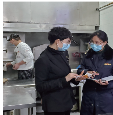
年夜饭供餐单位检查