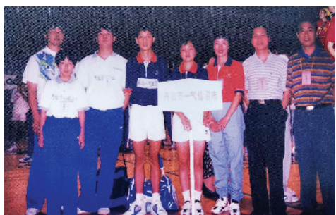
1997年8月,舟山市和气仙沼市组互派高中生乒乓球队,参加在北京举行的中日友好城市高中生乒乓球友谊赛。

一起发生在东海洋面的商船事故,历经2个半世纪风雨沧桑,居然又衍生出一段如此动人的中日友谊佳话,延续出一个个饱含深情的交往故事。中日两国一衣带水,友好往来源远流长。随着双方互动交流的增多,两国民众心灵相通、相互好感不断提升,中日关系会更有温度、更暖人心,类似相亲相融的中日友好故事会越来越来。